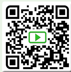
Bedienung & Funktion „Dokumente online“